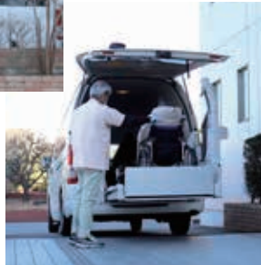
リフト付き福祉車両での送迎にも対応いたします。

当院の透析センターでは、通院が困難な透析患者様を対象に送迎サービスを行っています。患者様の状態に合わせられるよう、リクライニング車椅子でも送迎可能な車輛を準備しています。