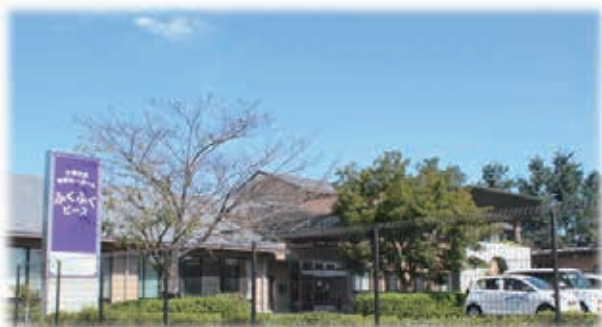
介護付き 有料老人ホーム ふくふくピース

当法人のケアピースグループの2施設が、新たに介護付有料老人ホームへと転換いたしましたのでご紹介をさせていただきます。介護付き有料老人ホームは、介護が必要で自宅での生活が困難な高齢者が入居できる施設です。施設スタッフによる日常生活や療養上のお世話、機能訓練など自立生活の援助を行います。原則24時間の介護サービスを受けられます。