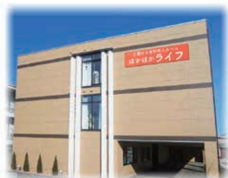
介護付き 有料老人ホーム ほかほかライフ

ご利用者様の生活に寄り添い、住み慣れた地域で暮らし続けたいという方のご希望に沿った安らぎにあふれる施設です。