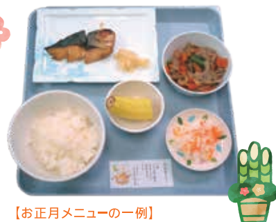
【お正月メニューの一例】