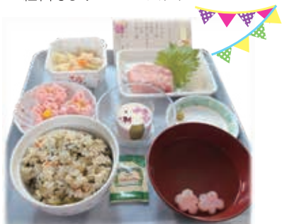
【誕生日祝膳の一例】